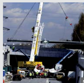
1 Espace Perret : requalification et développement d'un espace public de 20 000 m 2 , génie civil, revêtements minéraux et fontainerie, AMIENS AMENAGEMENT (80) 2 Parking de la Fosse aux Ours : parking enterré de 445 places sur 7 niveaux pour Parc Auto, Lyon (69) 3 Pont sur le Rhône : reconstruction d'un pont ferroviaire de 213 m pour RFF et SNCF, Culoz (01) 4 LGV EST : lot 14/21, création d'une tranchée couverte de 300 m de long sur l'A4 pour RFF, (51) 5 A86, couverture acoustique : extension de la semi couverture existante, pose de 288 coques en béton précontraint pour la DDE, Colombes (92)