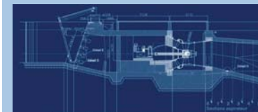
Coupe longitudinale de la centrale hydroélectrique de Roanne, puissance installée de 2,5 MW, 3 turbines.

► HYDRO MAÏA représente l'activité hydraulique du groupe. Actuellement une centrale de 2,5 MW est en construction et des projets de développement pour une puissance cumulée de 20 MW sont en cours.