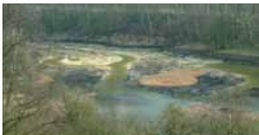
Terrassement et aménagement d'une roselière Roost-Warendin (59)

Nous réalisons vos projets dans un esprit de partenariat, de confiance et de proximité.